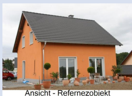
Ansicht - Referenzobjekt