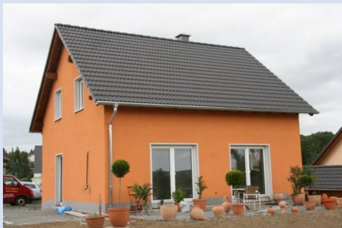
Ansicht - Referenzobjekt