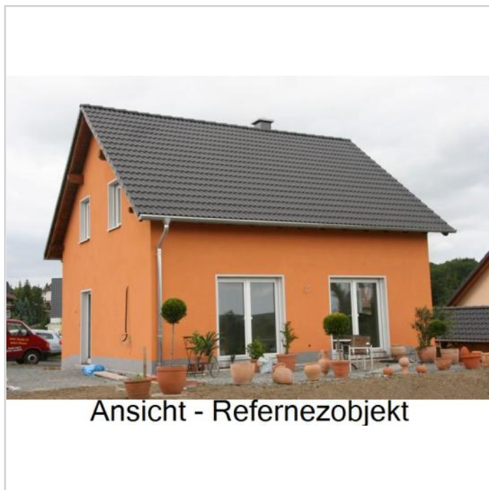
Ansicht - Referenzobjekt

Angebot inklusiv der gesamten Planungs- und Baunebenkosten ! Natürlich ist der Erwerb auch als Rohbauhaus oder in jeder anderen Ausbaustufe möglich. Die Erstellung erfolgt durch unseren Bauunternehmer - viele Referenzen zufriedener Kunden vorhanden.